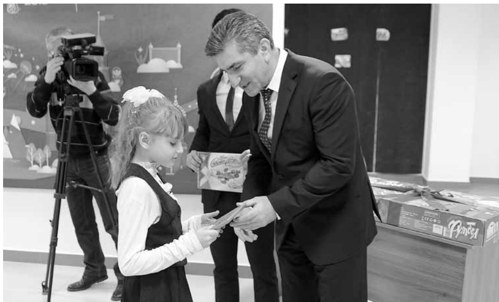
МИНИСТР ПО ФИЗИЧЕСКОЙ КУЛЬТУРЕ И СПОРТУ САМВЕЛ АРАКЕЛЯН ВРУЧАЕТ ВОСПИТАНИЦЕ РОСТОВСКОГО ПРИЮТА ПИСЬМО ОТ НАДИН КЕССЛЕР

— Футбол дарит прекрасную возможность творить добро и исполнять детские мечты, — рассказал министр по физической культуре и